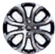
Cerchi in lega Clover 17"