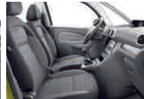
Tessuto Maxi - Armonia Mistral