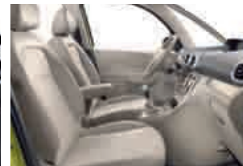
Pelle/Alcantara® e tessuto Matinal - Armonia Matinal