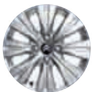
Cerchi in lega Blade 16"