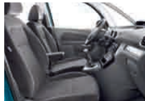
Tessuto Brise con inserti in velluto Mistral - Armonia Mistral