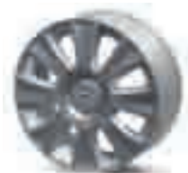
Cerchi in lega Suzuka 16" (venduto come accessorio. Fornito senza viti né borchie).