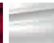
Bianco Absolut (O)