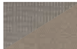
Tessuto Brise con inserti in velluto Matinal - Armonia Matinal