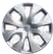
Copricerchi Como 16"