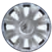
Copricerchi Inca 15"